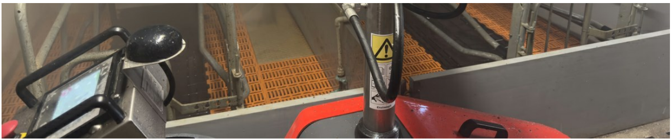
Uppstart av EVO Cleaner i ett BB-stall, Polen